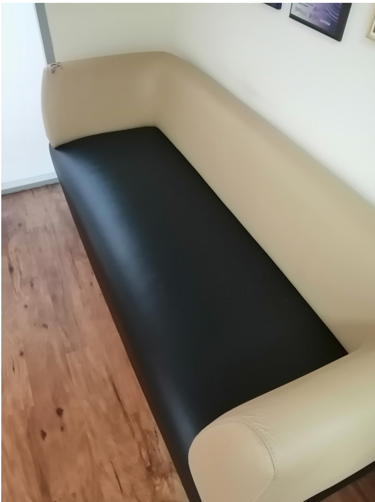
Диван модульный Бали 3-х местный – 2 шт.